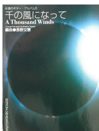
楽譜集 『千の風になって』 現代ギター社刊