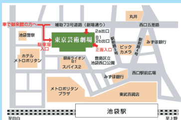
会場：東京芸術劇場のアクセス

30余年に渡る地道な演奏活動から紡がれる品位ある豊かな音色と音楽性から「六弦の魔術師」の異名を持つ。曲の個性を巧みに引き出すソロ・ギター・アレンジは定評があり、現代ギター社より多数の編曲集を出版。還暦を迎えた2007年コロムビアミュージックエンタテインメントよりメジャー・デビュー。新聞、ラジオ、TV等メディアに多数取り上げられる。日本橋三越ほかデビュー記念コンサート&サイン会開催。CDはラジオジャパン、NHK「ラジオ深夜便」「あさいちばん」等全国で放送中。